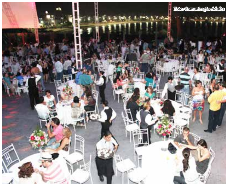
Tradicional Festa do Professor foi sucesso de público.

Quem não fez a foto deve providenciar uma. É só passar na Adufes para tirar a fotografia na Assessoria de Comunicação. A carteirinha será entregue em breve.