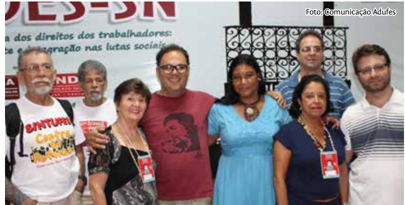
Delegados da Adufes no 33º Congresso do Andes-SN.

2014: ano de luta em defesa da Educação. O 33º Congresso reafirmou o seu compromisso de luta pela educação pública e gratuita ao aprovar a intensificação de ações que denunciam o descaso do governo em relação à política educacional. Nesse sentido, os professores reafirmam o seu compromisso de construção do Encontro Nacional de Educação em conjunto com sindicatos, entidades estudantis e movimentos sociais. É imprescindível, alerta o documento final do 33º Congresso, a continuidade da luta contra os Projetos de Lei que atacam o preceito constitucional de educação como direito de todos e dever do Estado.